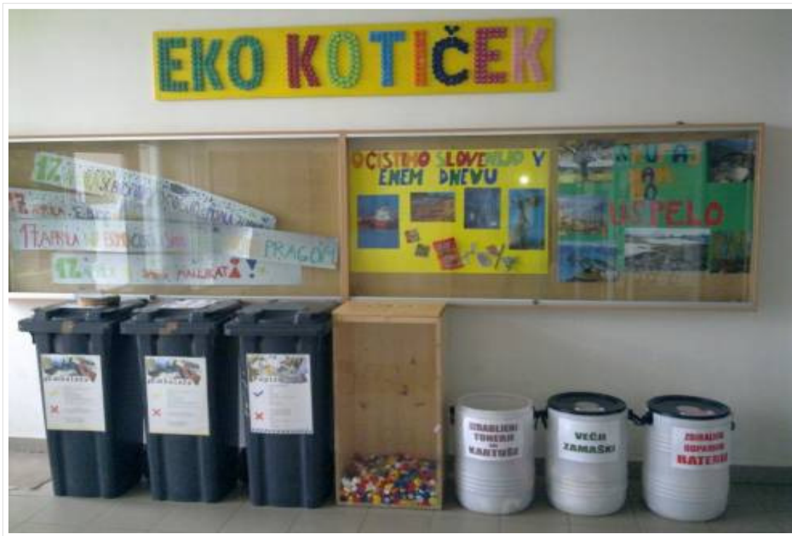
Prostor za poljubno EKO fotografijo za naslovnico